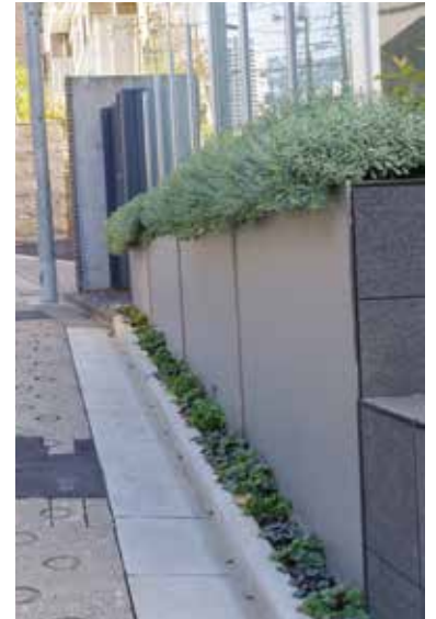
設計：(株)K3 建築研究所